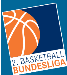
Tabelle Pro B Saison 2010/11